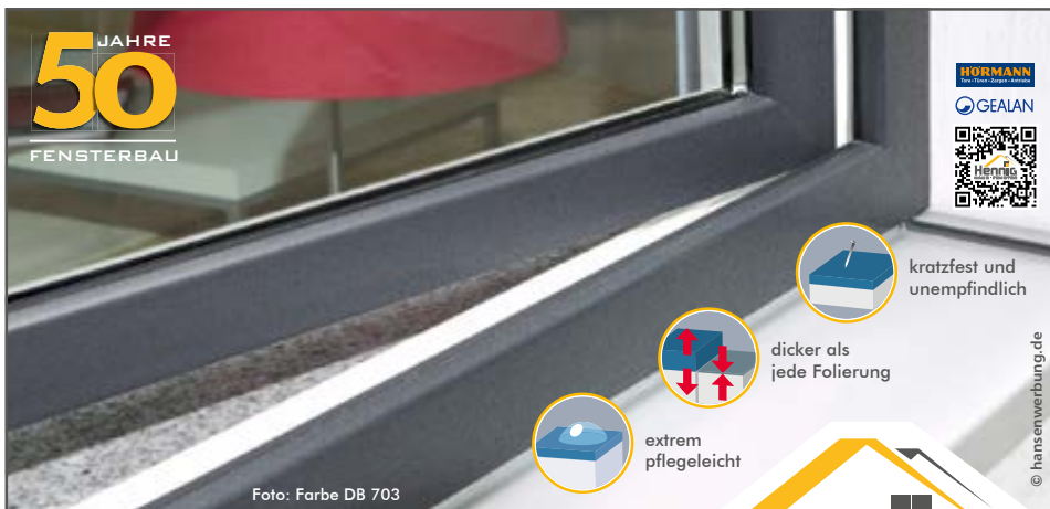
Foto: Farbe DB 703